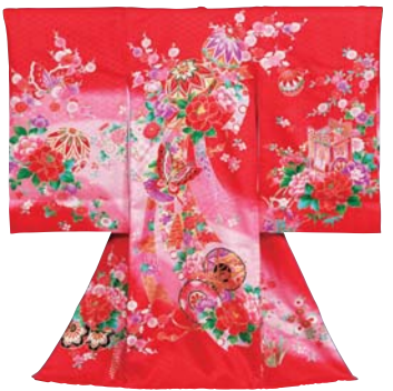
女祝着 鶴に鼓 税込 33,000円 (税抜 30,000円) 申込番号 059-00151-00 日本製 ●材質 / 表:絹100%、裏:ポリエステル100% ●カラー / 赤(6734-1)059-01151-00