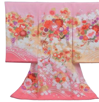
女祝着 香 花車に白桜 税込 66,000円 (税抜 60,000円) 申込番号 059-00167-00 日本製 ●材質 / 表:絹100%、裏:ポリエステル100% ●カラー / ピンク(6741-1)059-01167-00