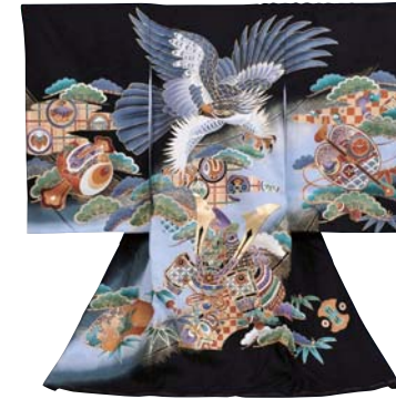
男祝着 鷹に兜 家紋市松 税込 44,000円 (税抜 40,000円) 申込番号 059-00153-00 日本製 ●材質 / 表:絹100%、裏:ポリエステル100% ●カラー / 黒(6705)059-01153-00