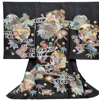
男祝着 世 小楯に軍配 税込 55,000円 (税抜 50,000円) 申込番号 059-00159-00 日本製 ●材質 / 表:絹100%、裏:ポリエステル100% ●カラー / 黒(6710-1)059-01159-00