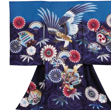
男祝着 鷹に散らし菊 税込 66,000円 (税抜 60,000円) 申込番号 059-00165-00 日本製 ●材質 / 表:絹100%、裏:ポリエステル100% ●カラー / 群青(6712)059-01165-00