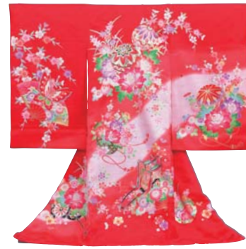
女祝着 鶴に花籠 税込 33,000円 (税抜 30,000円) 申込番号 059-00150-00 日本製 ●材質 / 表:絹100%、裏:ポリエステル100% ●カラー / 赤(6736)059-01150-00