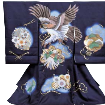
男祝着 鷹に纏 税込 44,000円 (税抜 40,000円) 申込番号 059-00152-00 日本製 ●材質 / 表:絹100%、裏:ポリエステル100% ●カラー / 紺(6906)059-01152-00