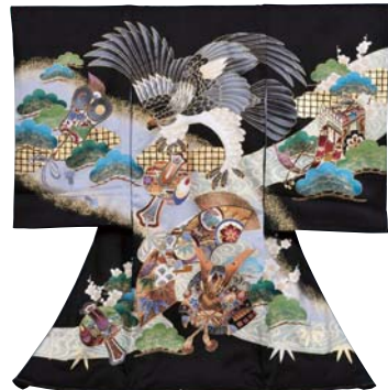
男祝着 鷹に兜 金屏風 税込 33,000円 (税抜 30,000円) 申込番号 059-00148-00 日本製 ●材質 / 表:絹100%、裏:ポリエステル100% ●カラー / 黒(6704-1)059-01148-00