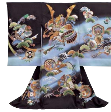
男祝着 健兜に扇面 税込 44,000円 (税抜 40,000円) 申込番号 059-00154-00 日本製 ●材質 / 表:絹100%、裏:ポリエステル100% ●カラー / 黒(6706-1)059-01154-00