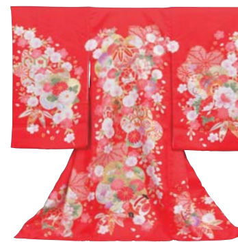
女祝着 純 鶴に鼓 税込 55,000円 (税抜 50,000円) 申込番号 059-00163-00 日本製 ●材質 / 表:絹100%、裏:ポリエステル100% ●カラー / 赤(6740)059-01163-00