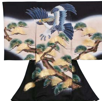
男祝着 鷹に松 税込 66,000円 (税抜 60,000円) 申込番号 059-00166-00 日本製 ●材質 / 表:絹100%、裏:ポリエステル100% ●カラー / 黒(6711)059-01166-00