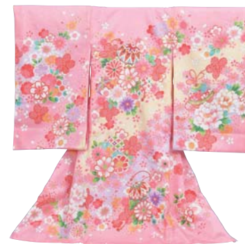
女祝着 兎 鶴に花づくし 税込 44,000円 (税抜 40,000円) 申込番号 059-00156-00 日本製 ●材質 / 表:絹100%、裏:ポリエステル100% ●カラー / ピンク(6736-1)059-01156-00