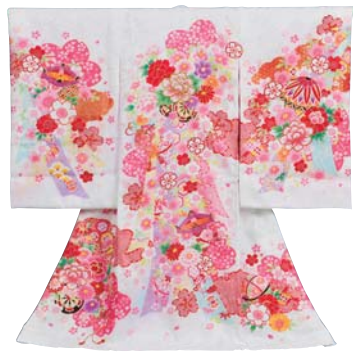
女祝着 花車に熨斗 税込 55,000円 (税抜 50,000円) 申込番号 059-00161-00 日本製 ●材質 / 表:絹100%、裏:ポリエステル100% ●カラー / 白(6737)059-01161-00