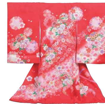
女祝着 鼓に折鶴 税込 44,000円 (税抜 40,000円) 申込番号 059-00155-00 日本製 ●材質 / 表:絹100%、裏:ポリエステル100% ●カラー / 赤(6936)059-01155-00