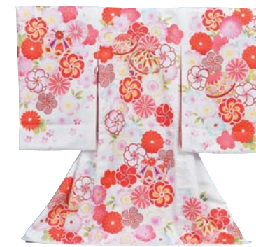
女祝着 芝 鶴にねじり梅 税込 55,000円 (税抜 50,000円) 申込番号 059-00162-00 日本製 ●材質 / 表:絹100%、裏:ポリエステル100% ●カラー / 白(6741)059-01162-00