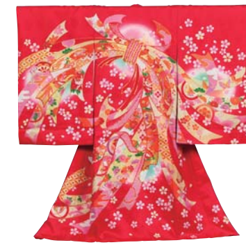
女祝着 桜吹雪に東ね熨斗 税込 66,000円 (税抜 60,000円) 申込番号 059-00168-00 日本製 ●材質 / 表:絹100%、裏:ポリエステル100% ●カラー / 赤(6741-2)059-01168-00