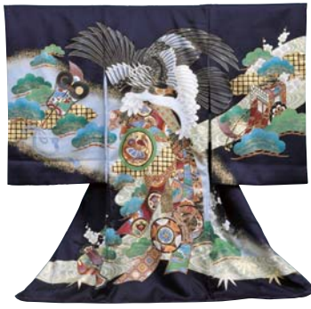
男祝着 鷹に熨斗・御所車 税込 33,000円 (税抜 30,000円) 申込番号 059-00098-00 日本製 ●材質 / 表:絹100%、裏:ポリエステル100% ●カラー / 紺(6704)059-01098-00