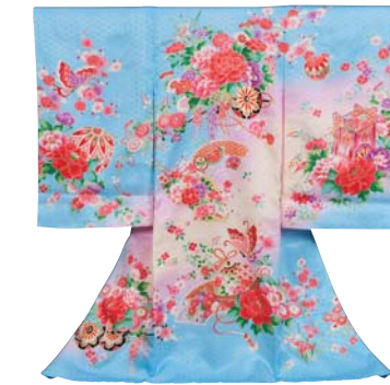
女祝着 花車に鶴 税込 44,000円 (税抜 40,000円) 申込番号 059-00157-00 日本製 ●材質 / 表:絹100%、裏:ポリエステル100% ●カラー / 水色(6735)059-01157-00