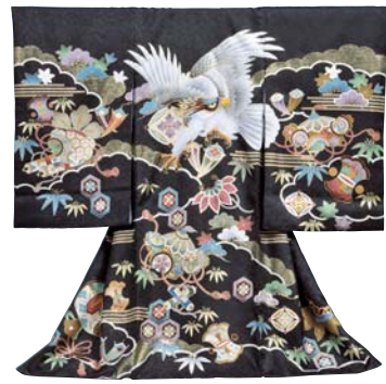
男祝着 世 鷹に宝尽くし 税込 55,000円 (税抜 50,000円) 申込番号 059-00158-00 日本製 ●材質 / 表:絹100%、裏:ポリエステル100% ●カラー / 黒(6710)059-01158-00