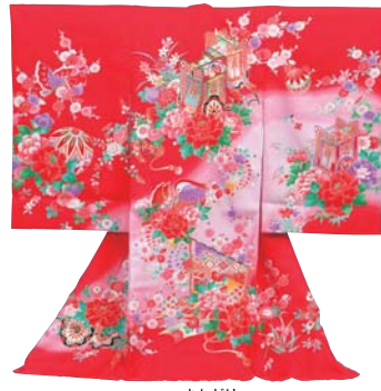
女祝着 御所車に鴛 税込 33,000円 (税抜 30,000円) 申込番号 059-00149-00 日本製 ●材質 / 表:絹100%、裏:ポリエステル100% ●カラー / 赤(6734)059-01149-00