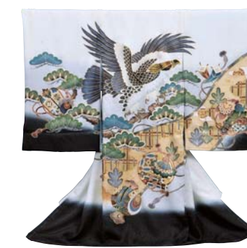
男祝着 鷹に小楯 税込 55,000円 (税抜 50,000円) 申込番号 059-00160-00 日本製 ●材質 / 表:絹100%、裏:ポリエステル100% ●カラー / 白(6710-2)059-01160-00