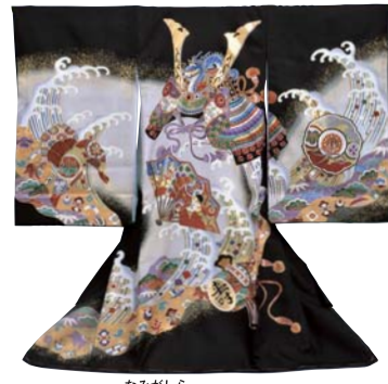
男祝着 鷹に波頭 税込 33,000円 (税抜 30,000円) 申込番号 059-00099-00 日本製 ●材質 / 表:絹100%、裏:ポリエステル100% ●カラー / 黒(6706)059-01099-00