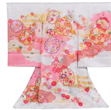
女祝着 散らし桜に雲取り 税込 66,000円 (税抜 60,000円) 申込番号 059-00169-00 日本製 ●材質 / 表:絹100%、裏:ポリエステル100% ●カラー / 白(6740-1)059-01169-00