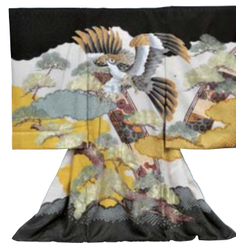
男祝着 鷹に足田 税込 66,000円 (税抜 60,000円) 申込番号 059-00164-00 日本製 ●材質 / 表:絹100%、裏:ポリエステル100% ●カラー / 黒(6710-3)059-01164-00