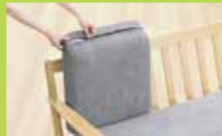
カバーリング仕様。