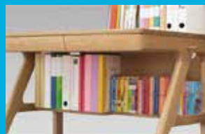
大容量の脚元収納。